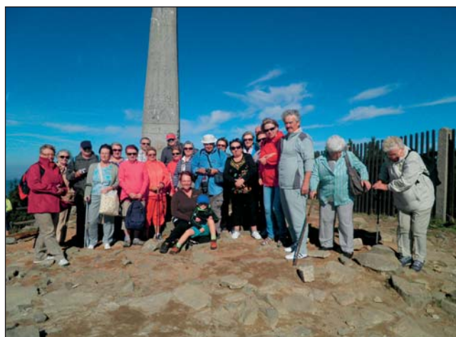
ÚČASTNÍCI čtvrtečního výletu na Lysou horu.